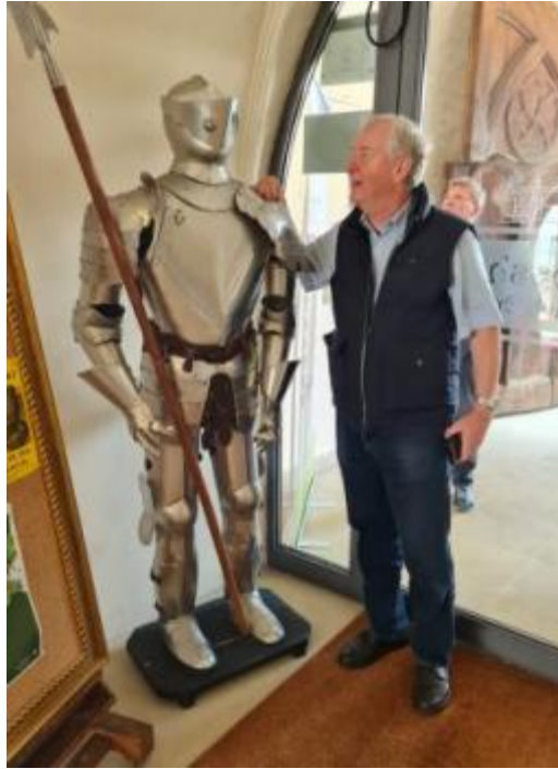
Schloßherr und seine Schloßwache Rundgang mit einer Rentnertruppe aus Dresden und 2 Berlinern