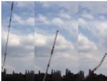
Ein halbes Jahrhundert standhaft, am Samstagmittag war es vorbei: Der Rias-Sendemast in Berlin-Britz wurde gesprengt.