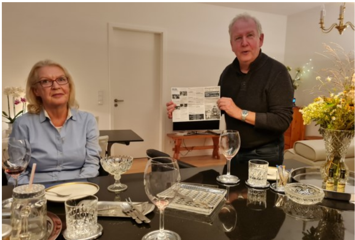
Und wie üblich zum Jahresabschluß 22.12.2021