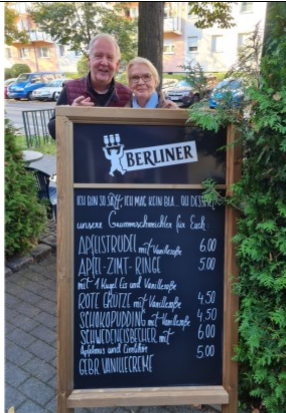
Und in der Charlotte 138/27